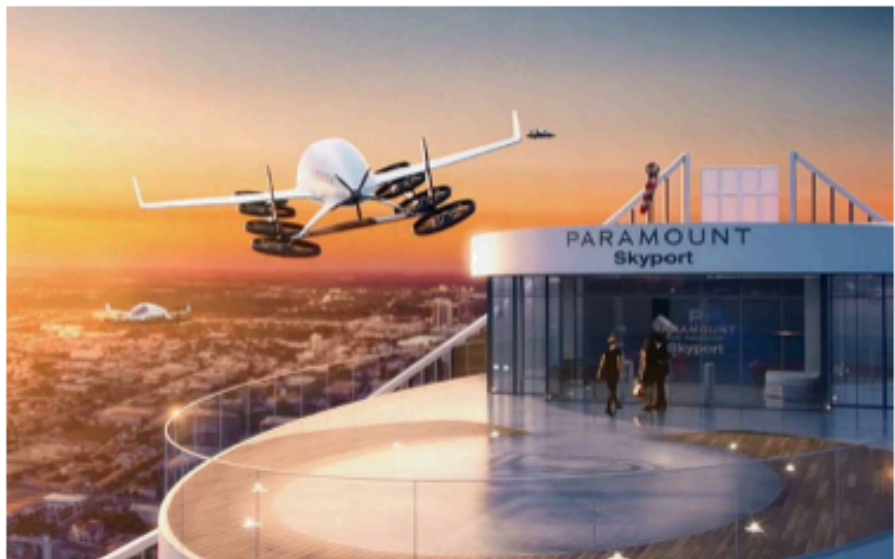
El edificio Paramount, de alrededor de 213 metros de altura, ofrece vistas a la ciudad y a la bahía, y su finalización está prevista para la primavera de 2019

La torre Paramount, en el corazón de Miami, incorporará en su azotea un puerto aéreo