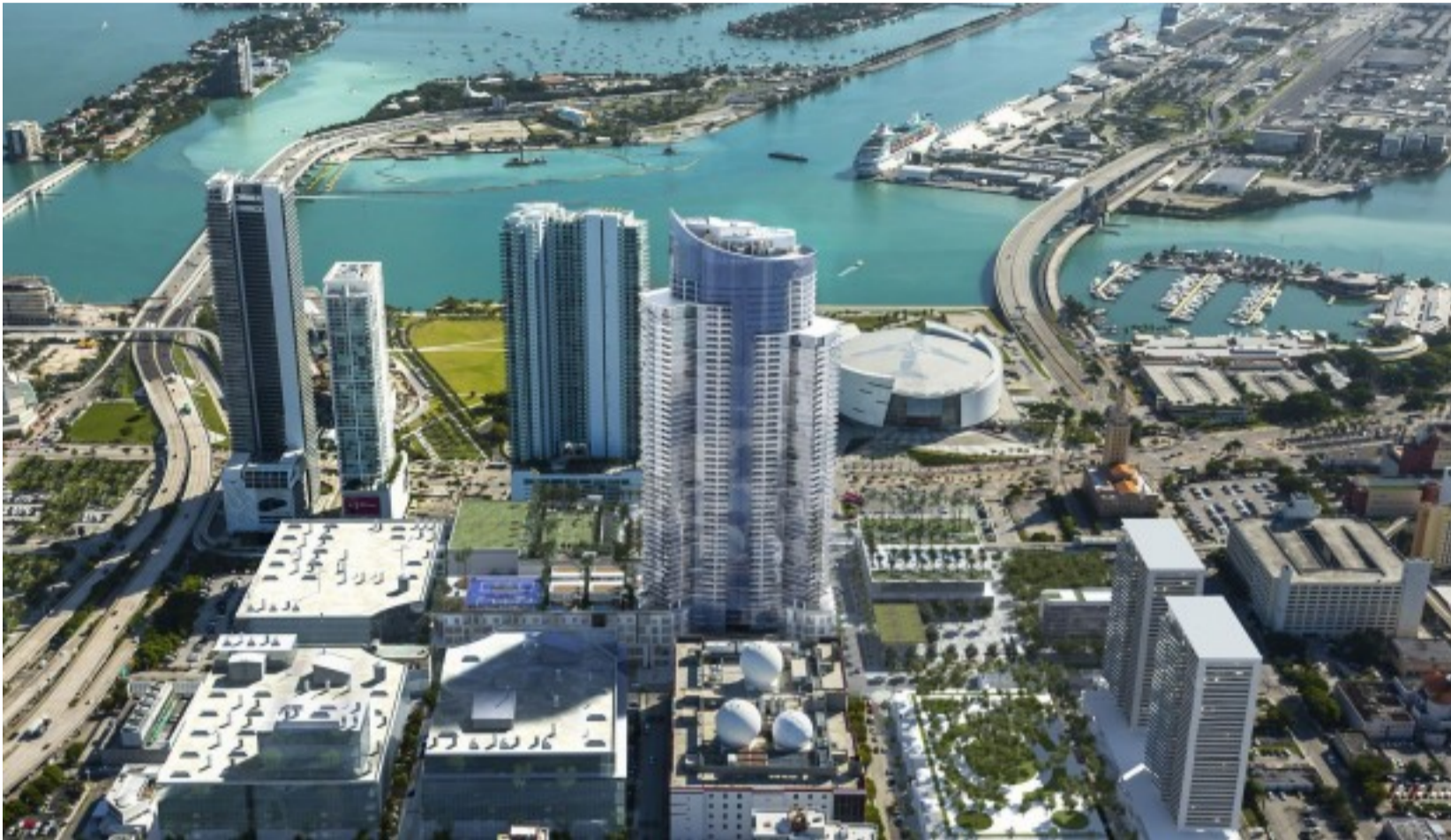
El Paramount Miami tiene previsto llegar a su punto más alto en los próximos tres meses.

Con un 3,5%, Perú está en el noveno lugar de la lista de compradores de finca raíz en la ciudad de Miami. Los primeros en liderar esta lista son Argentina con un 14% y Venezuela con un 9%